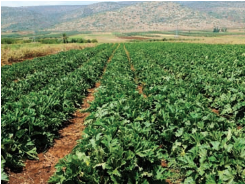
קרקע חקלאית. עם קק"ל נחתם חוזה חכירה ולא חוזה רכישה מסיבה פוליטית בלבד צילום: ??????

כלומר, גם כאשר נרשמה הקרקע על שם קק"ל כמי שנאמנה על מקרקעי העם היהודי, וזכויות ההתיישבות התמצו בזכויות חכירה לתקופות קצובות, היה ברור, כפי שברור עד היום, שנקודת יישוב אינה מוקמת "כמאחז