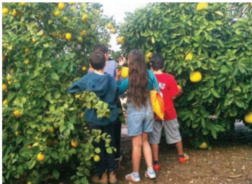
משהו מעניין מאוד בפרדס של עופר. באותם ימים לא הייתה טלוויזיה

אותי, יושקה היה מצרף לשמעיה, שקפץ על רגל אחת וגרר את השנייה הקשורה בכרוזלים וברצועות, שריד למגפת הפו