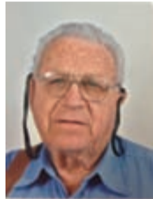
יורה ארצי, מתכנן חקלאי וקמ"ט חקלאות באיו"ש בשנים '68-91

סיים לסיור בגדה: המנהלה, המומחים, המדריכים הראשיים ובראשם שר החקלאות אריק שרון, ואני לידו כמוביל ומנחה בדרכים ומספר באוטובוסים על עבודתנו ביהודה ושומרון. פנינו צפונה וביקרנו בנפות טול-כרם-קלקי-ליה, ג'ניו, שכם, רמאללה, הצצנו בשדות ובכרמיים. לבקעה, לבית לחם ולחברון לא הגענו באותו יום. שוחחנו הרבה עם השר על עבודתנו, הגיגינו, שאיפתנו ועזרתנו לחקלאים שם. לסיכום, אומר שהייתה בינינו "כמעט" אהדות דעות לדרכנו, לשיטתנו ולהדרכותינו. אריק שרון הודה לנו מאוד על עבודתנו ובירכנו על המשך שיתוף הפעולה בינינו ועם החקלאים מהכפרים הערביים. אנו, הצוות הישראלי בגדה, כ-20 איש בעלי ניסיון ומקצוע, עלצנו והתעוררנו מגישת השר ובירכנוהו. עם שקיעת החמה נפרדנו מאיש נפלא זה, הצטיי ערנו שלא הספקנו ולא יכולנו להיפגש עם החקלאים באותו היום בבתיהם. אולי ההפסד לשני הצדדים, מי יודע? יאה זכרו ברוך, אהבנוהו ונמשיך לאהבו. שלום לך, אריק שרון. ובשם כל הצוות הישראלי המסור שעלה וירד לגדה לפעילות מבורכת עשרות שנים, אנו נפרדים, ובתקווה!