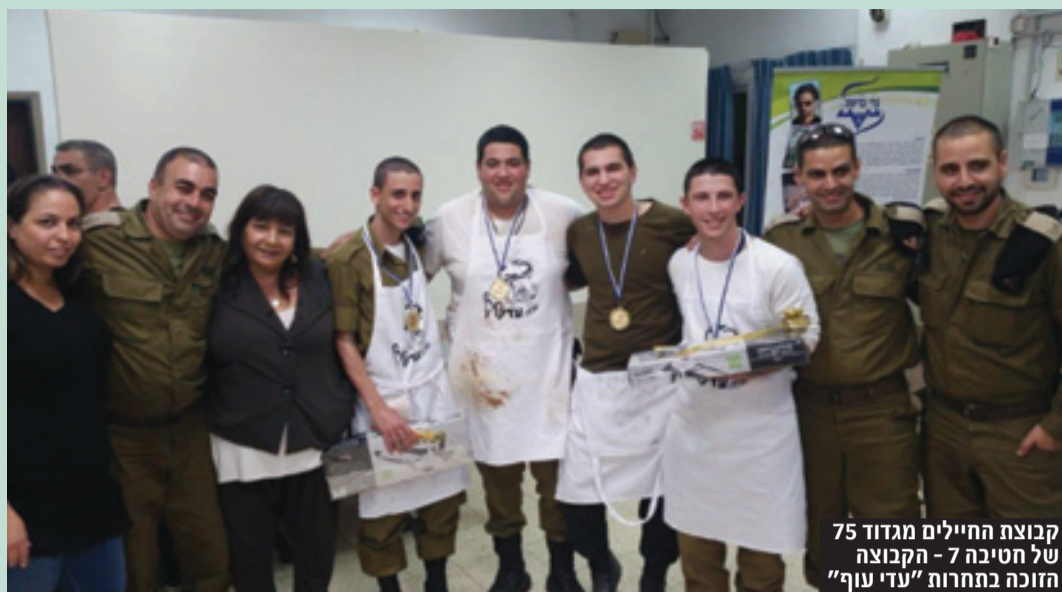
קבוצת החיילים מגדוד 75 של חטיבה 7 - הקבוצה הזוכה בתחרות "עדי שף"