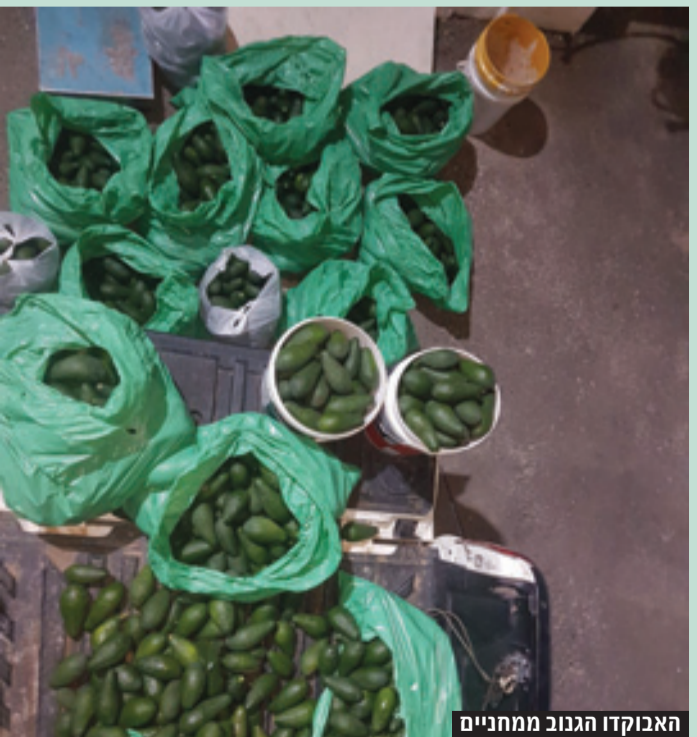
האבוקדו הגנוב ממחניים

המאבק בפשיעה החקלאית נמשך: שוטרי משמר הגבול של ישראל תפסו "על חם" חשוד בגניבת תוצרת חקלאית במשקל של כ-345 ק"ג, בתחום המועצה האזורית הגליל העליון. הפעילות העקבית והמתמשכת של שוטרי מג"ב במאבק בפשיעה החקלאית כוללת פעילויות יזומות ופעילויות ממוקדות, שילוב כוחות גלויים וסמויים, אמצעים טכנולוגיים מתקדמים ועוד. כשבוע שעבר התקבל דיווח בדבר חשודים שגונבים תוצרת חקלאית מסוג אבוקדו במטע בקיבוץ מחניים. שוטרי מג"ב שהגיעו למקום, הבחינו בשני חשודים שהחלו להימלט מהשוטרים. לאחר מרדף רגלי נתפס חשוד אחד. במקום אותרו מספר גדול של שקיות ובתוכן אבוקדו, שהיו מוכנות להעמסה על רכב. החשוד, בשנות ה-50 לחייו, תושב צפת, הועבר לחקירה במשמר הגבול ונלקח להארכת מעצר בפני בית משפט השלום בטבריה. התוצרת החקלאית הוחזרה לבעלים החוקיים.