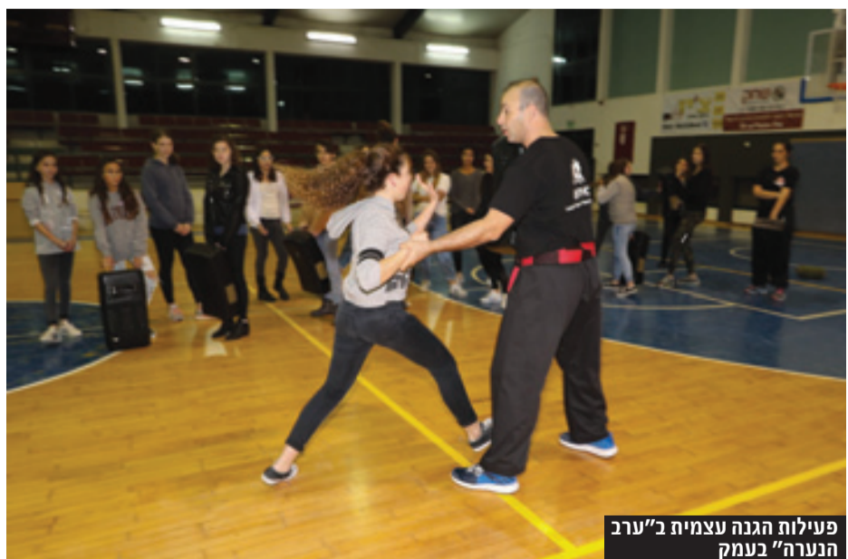
פעילות הגנה עצמית ב"ערב הנערה" בעמק

שעבר את פורום העסקים "מעצבים את הגליל" - פורום ייחודי לאדריכלים, מעצבי פנים והום סטיילינג, הרוצים למנף את העסק שלהם לשלב הבא. ליאור כרמלי דובדבני , רכזת היזמות במעברים גליל מערבי ו גבי הילס , פייתוח קריירה ובינוי קהילה מרכז צעירים מטה, דאגו לפתיחה מעניינת ולגיבוש חברות הפורום החדש. מיי-טל דרורי גנגרינוביץ , יועצת ארגונית, קהילתית ומנחת קבוצות, היא המלווה את הפורום ואת המפגשים.