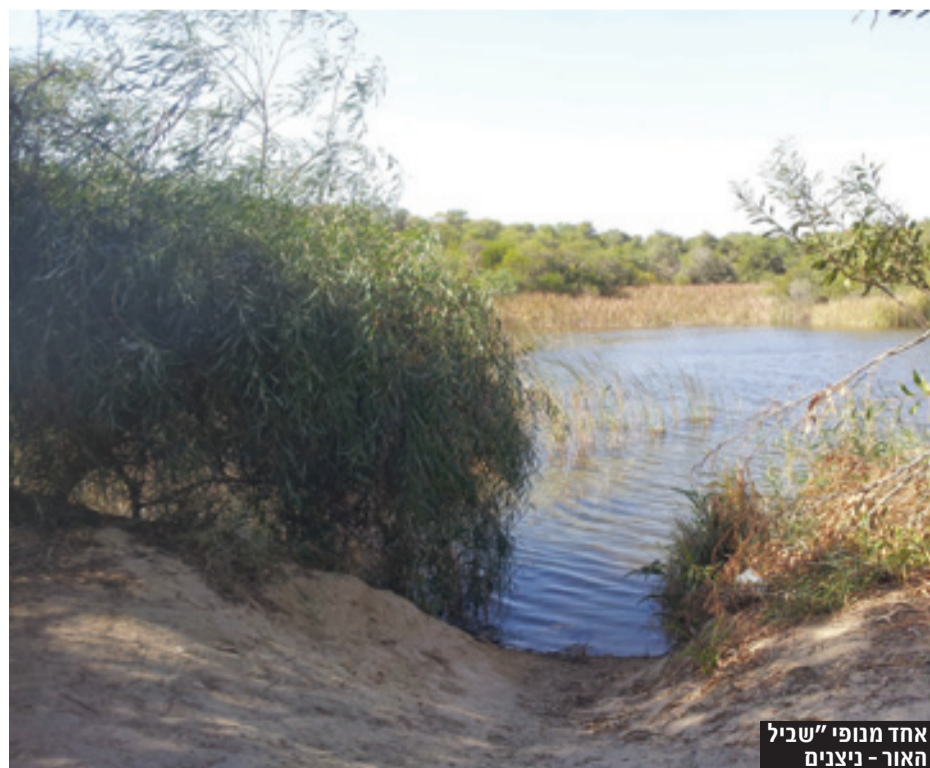
אחד מנופי "שביל האור" - ניצנים