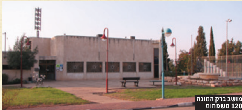
מושב ברק המונה 120 משפחות

חשנו התרוממות רוח מעצם היותנו בארץ, חשנו שאנו תורמים משהו לבנין המדינה הצעירה. ציונות צרופה! הימים נקפו ואנחנו עדיין "פועלי דחק" של הסוכנות ולא מושבניקים כפי שציפינו להיות. משנוכחנו כי לא "בוער" למוסדות המיישבים וכי ככוונתם להמשיך במשטר האפסטרופסות ולנהל אותנו בקצב שלהם, נאלצנו לשבות ולהפגין ע"מ לדרבן אותם להעמיד לר-שותנו את האדמות ואת אמצעי הייצור לעבודה עצמית. וכך היה. למרות הליווי של המדריכים, ההצלחה לא האירה לנו פנים בהתחלה מחמת חוסר ידע וניסיון. חלק מהחברים עזבו את המושב באין יכולת להכיל את הקשיים ולהתמודד עם המהפכה הכרוכה במעבר מחיי עיר תוססים לפרנסה מהאדמה. אך רוב החברים גילו כושר עמידה ונשאו במושב. כנראה הגשמת החזון הייתה חזקה יותר מהאכזבה מהמציאות. אלה שהתמידו והתמסרו לאדמה פיתחו לאורך זמן משקים מבוססים: מי בגידולי