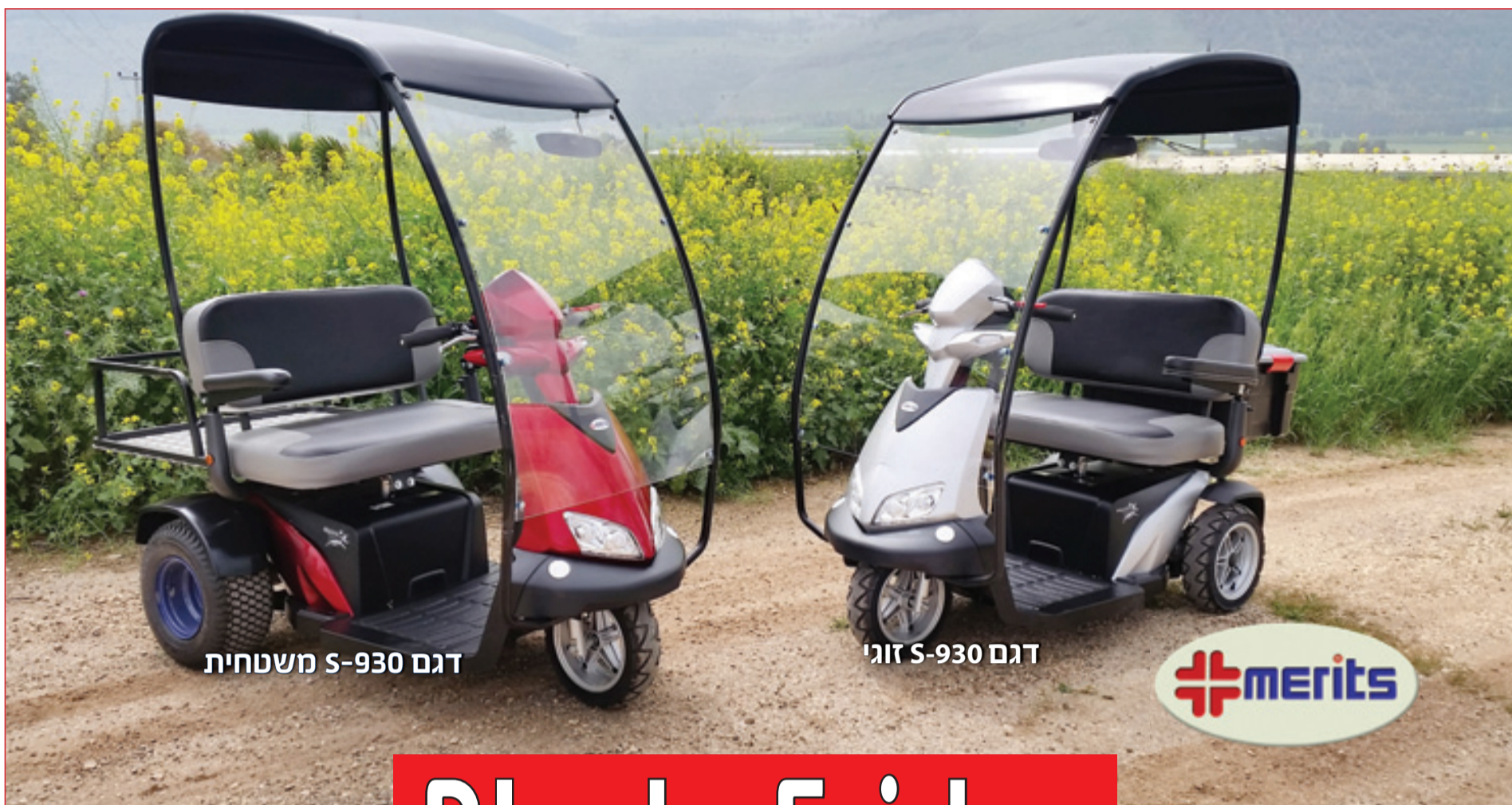
דגם S-930 משטחית