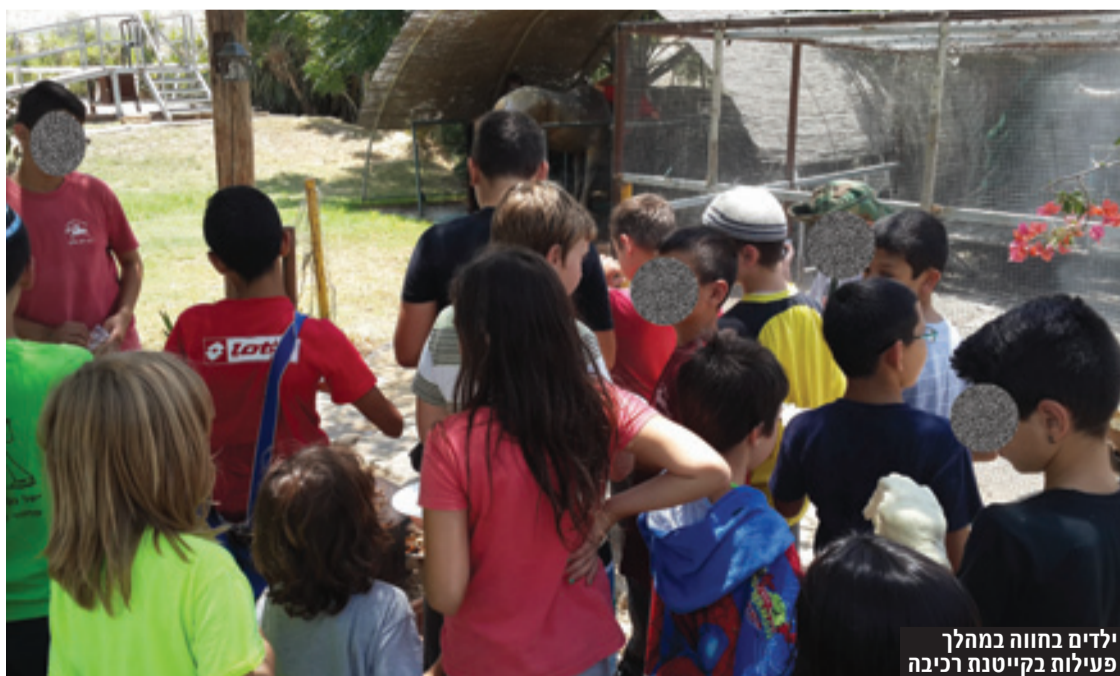
ילדים בחווה במהלך פעילות בקייטנת רכיבה

"מפנים אלינו ילדים רבים עם בעיות של הפרעת קשב וריכוז (ADHD ו-ADD). הילד ההיפראקטיבי יותר מתחבר לרכיבה כי זה העניין שלו, הוא אוהב להיות פעיל, הקצב והתנועה מרכזת אותו והוא לומד להתאים את עצמו למסגרת התנועתית של הסוס. הוא מתחיל לפתח ערכים נוספים במקביל כבניית תרגילים ברצף ועוד..."