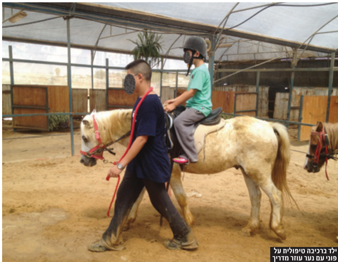
ילד ברכיבה טיפולית על פוני עם נער עוזר מדריך

“לצערתי, יש כאלה שמגיעים אלינו היישר ממערכת החינוך שלנו היום. במקרים רבים המורה מוצאת את עצמה מול 40 ילדים, היא עסוקה במשמעת ובהוראה ולא רואה את העולם האישי של הילד, לא מזהה בעיות. ואז מתחיל מעין סידור או כדור שלג גדול שאומר לילד: 'אתה לא טוב במקצוע הזה, ובוה, ובוה', ומשם הכדור מתחיל להתגלגל במ' דרון ההר.