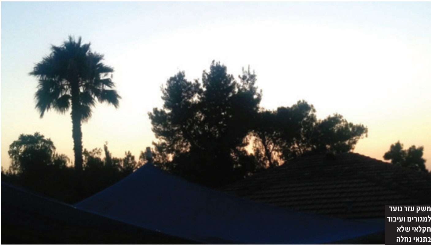
משק עזר נועד למגורים ועיבוד חקלאי שלא נחלה

החלטה חדשה שאושרה על ידי מועצת מקרקעי ישראל ונחתמה ביום 19.11.17 על ידי שר האוצר ומספרה 1521, העוסקת בהיוון ופיצול משקי עזר – מקנה הטבות לבעלי משקי העזר ויוצרת תמריץ לבצע תהליך של היוון הזכויות