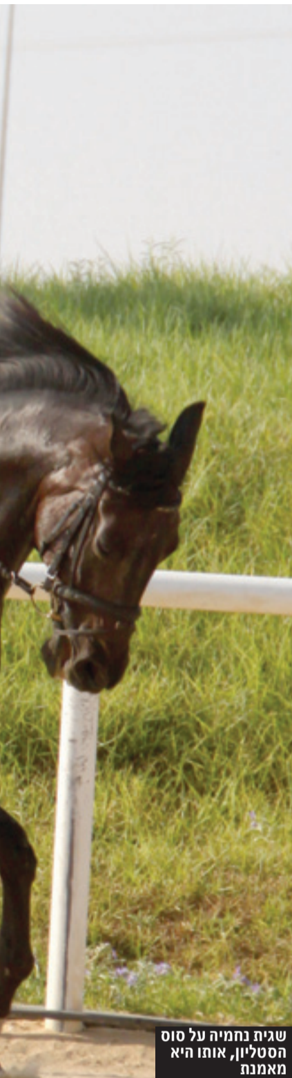
שגית נחמיה על סוס הסטילון, אותו היא מאמנת

"טוב, הרכיבה הטיפולית קיימת ומראה תוצאות כבר עשרות שנים בחו"ל, אם לא יותר. מדובר מתודי' קה שלא רק מוכחת מדעית כעוב' דת, באירופה זה היה קיים כבר לפני כמה שנים ואילו לארץ זה הגיע