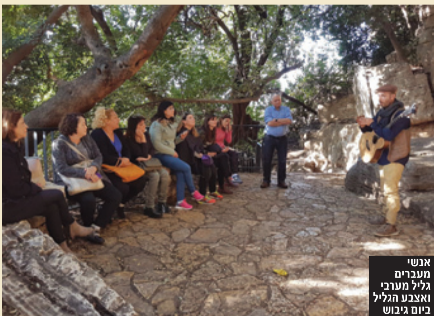
אנשי מעברים גליל מערבי ואצבע הגליל ביום גיבוש

צוות מעברים גליל מערבי בשיתוף צוות מעברים אצבע הגליל, מרכזי תעסוקה קהילתיים הפועלים לקידום פיתוח כלכלי ותעסוקה בגליל, יצאו ליום גיבוש מרתק בחורפש ובפקיעין, בעקבות עסקים ויוזמות קהילתיות.