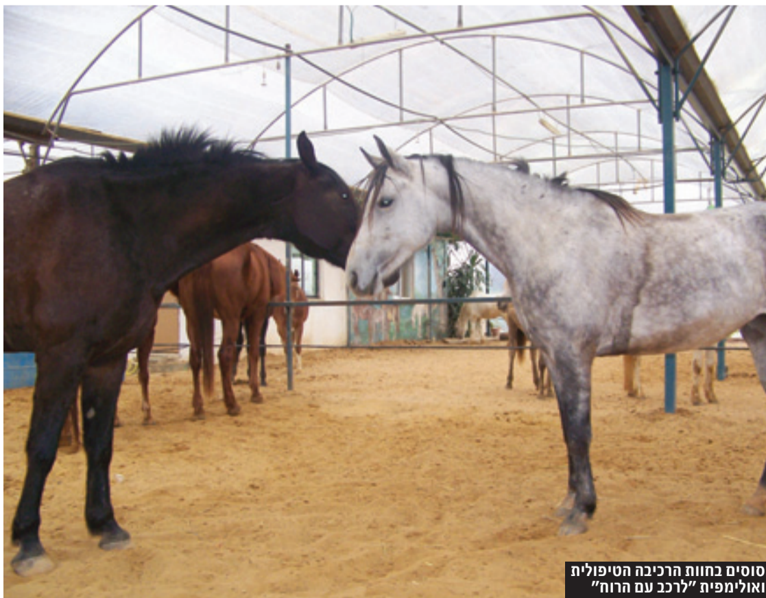
סוסים בחוות הרכיבה הטיפולית ואולימפית "לרכב עם הרוח"

תוח הדימוי העצמי. חוג הרכיבה מתקיים בשעות אחר הצהריים במג רשי רכיבה מקורים ומתאים לגילאי 5 ומעלה. "מה שמייחד פה את המקום ומ קסים זה פיילוט שהקמתי לפני כמה שנים טובות. זה לא סוד שהאוכלוסייה בדרום לא משופעת באנשים עם כסף או בקיצור, אנחנו