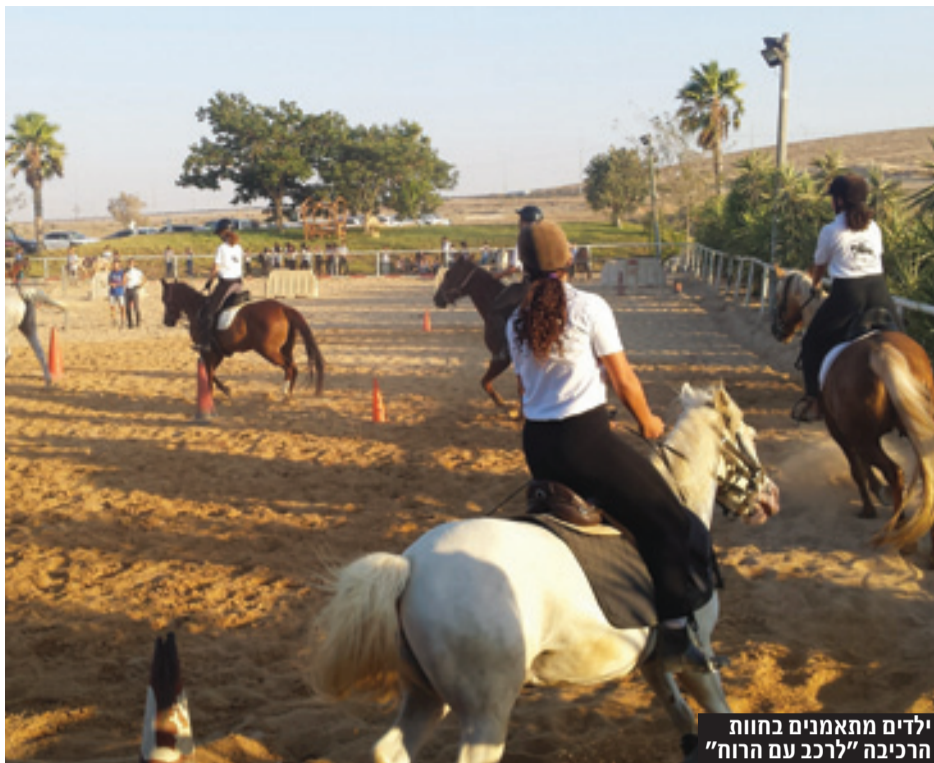
ילדים מתאמנים בחוות הרכיבה "לרכב עם הרוח"

שבעקבותיה הגיעו לכאן, אבל התאהבו ברכיבה ורוצים להמשיך. אותם נערים ונערות שנפתרה להם הבעיה עוזרים למדריכים ברכיבה טיפולית, עוזרים 3-4 שעות ועולים לאימון משלהם על הסוס חינם. מה קיבלת? רוכב מקצועי יותר.