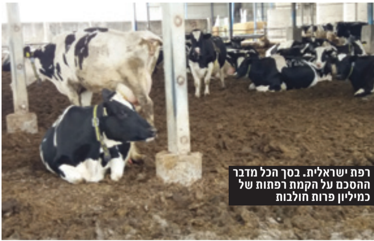
רפת ישראלית. בסך הכל מדבר ההסכם על הקמת רפתות של כמיליון פרות חולבות