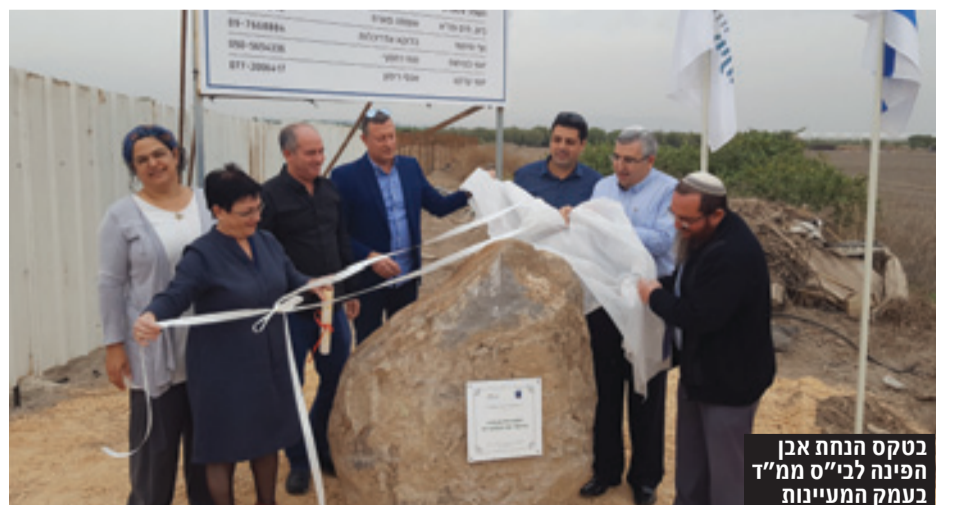
בטקס הונחה אבן הפינה לבי"ס ממ"ד בעמק המעיינות