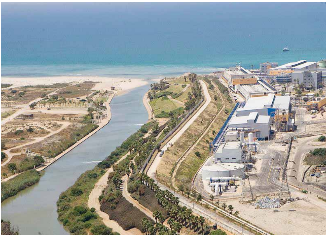
מתקן ההתפלה בחדרה. רק השנה חידשה הרשות את הקמת מתקני ההתפלה