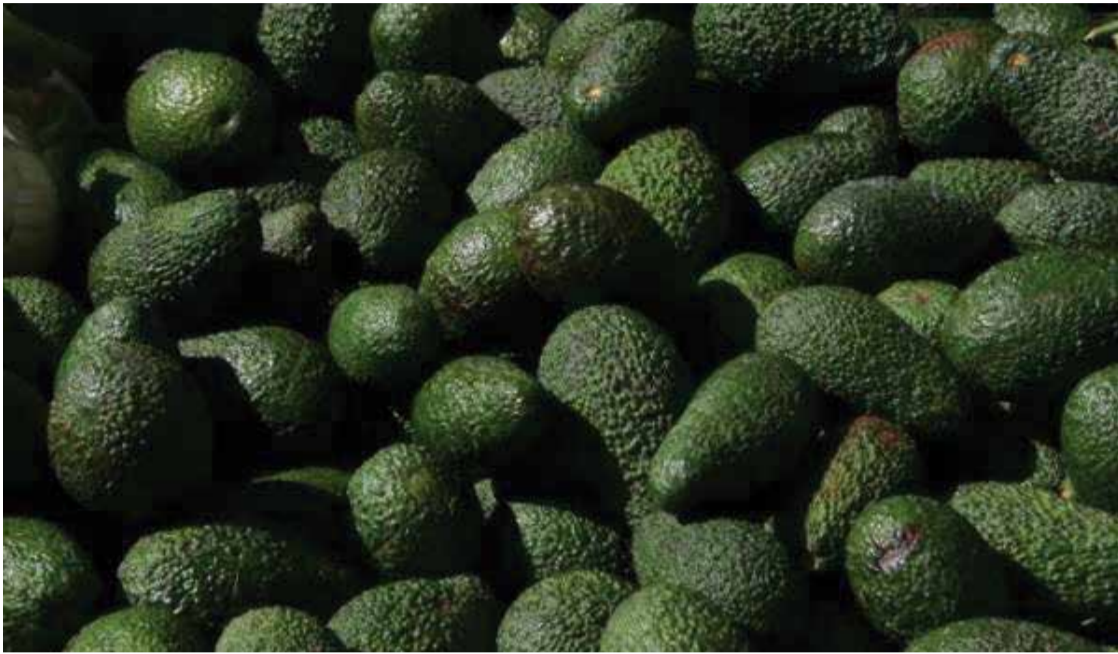
אבוקדו - גרנות הוא יצרן האבוקדו הגדול בישראל