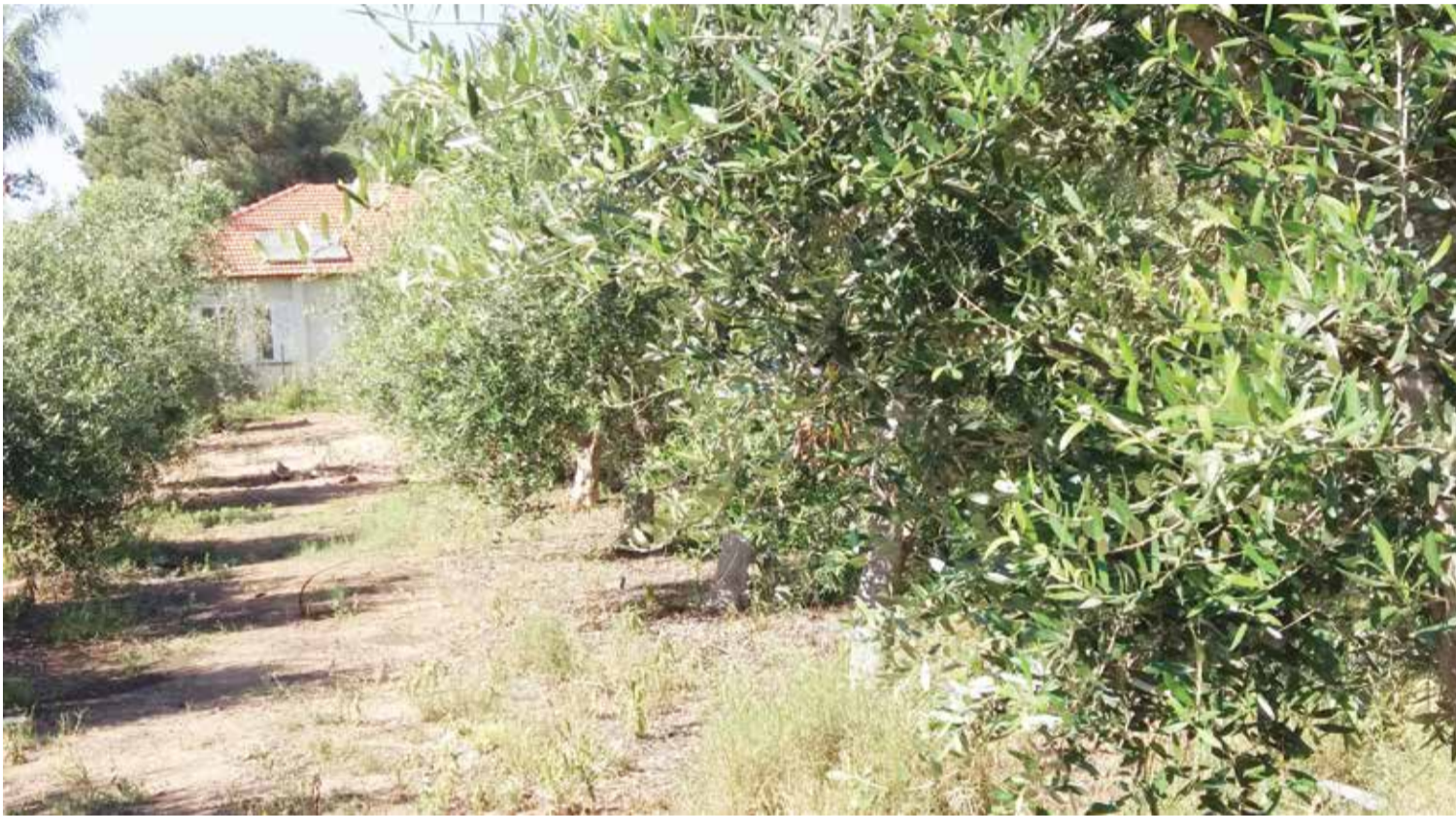
הדוקטור סייע לחברה ולגרשה (צילום אילוסטרציה)

התובע הגיש תביעה לפסיקת דמי שימוש בגין שימוש בלעדי במקרקעין משותפים כנגד אשתו לשעבר, אשר נשארה להתגורר במקרקעין לאחר פרידתם