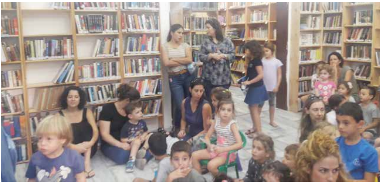
"משלבים כוחות" בתל עדשים