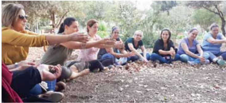
השתלמות צוותי החינוך ב"גני היער"

30 שעות השתלמות בנושא גני היער לצוותי החינוך בגנים ובבתי הספר