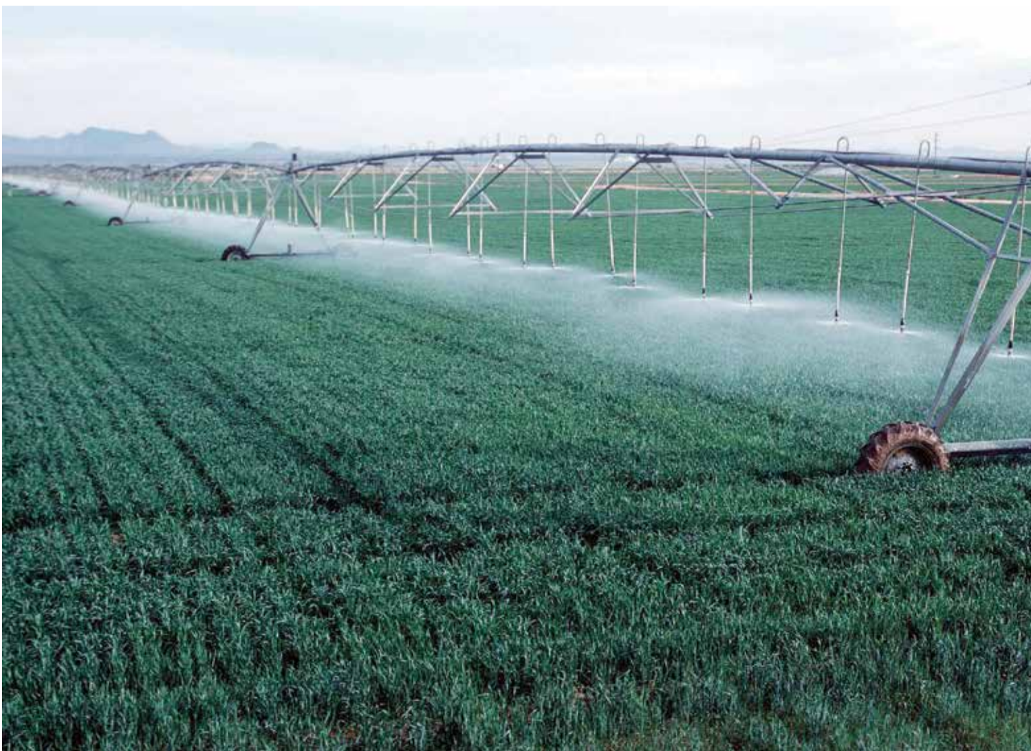
קו-נוע. "ככל שרשות המים תקדים לנקוט את הצעדים הדרושים כן ייטב"

וזאת אף שמשנת 2015 שבה מגמת העלייה בצריכת המים לנפש. כמו כן קובע הדו"ח, כי רשות המים מיהרה להגדיל את מכסות המים לחקלאות, לפני שהביאה את האוגר למצב ההידרולוגי הנדרש ולפני שהביאה את האקוויפרים למצב תפעול בגבולות הקווים הירוקים. כמו כן, בעת תכנון משאבי המים והקצאתם לחקלאות בשנים 2013 עד 2016 - רשות המים לא הביאה בחשבון את נתוני הצריכה בפועל ואת הביקוש למים לחקלאות.