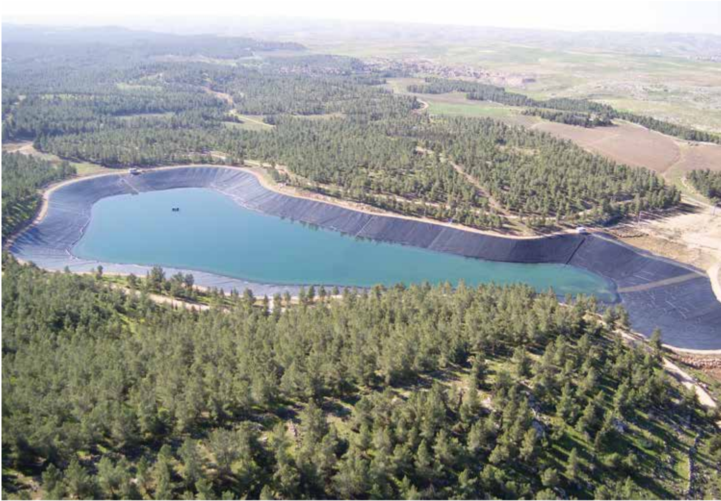
מאגר יתיר. בין היתר, לא שוקמו ולא פותחו מאגרי מים חדשים

עוד קובע דו"ח מבקר המדינה, כי רשות המים מיהרה להגדיל את מכסות המים לחקלאות, לפני שהביאה את האוגר למצב ההידרולוגי הנדרש ולפני שהביאה את האקוויפרים למצב תפעול בגבולות הקווים הירוקים. בעת תכנון משאבי המים והקצאתם לחקלאות בשנים 2013 עד 2016 - רשות המים לא הביאה בחשבון את נתוני הצריכה בפועל ואת הביקוש למים לחקלאות