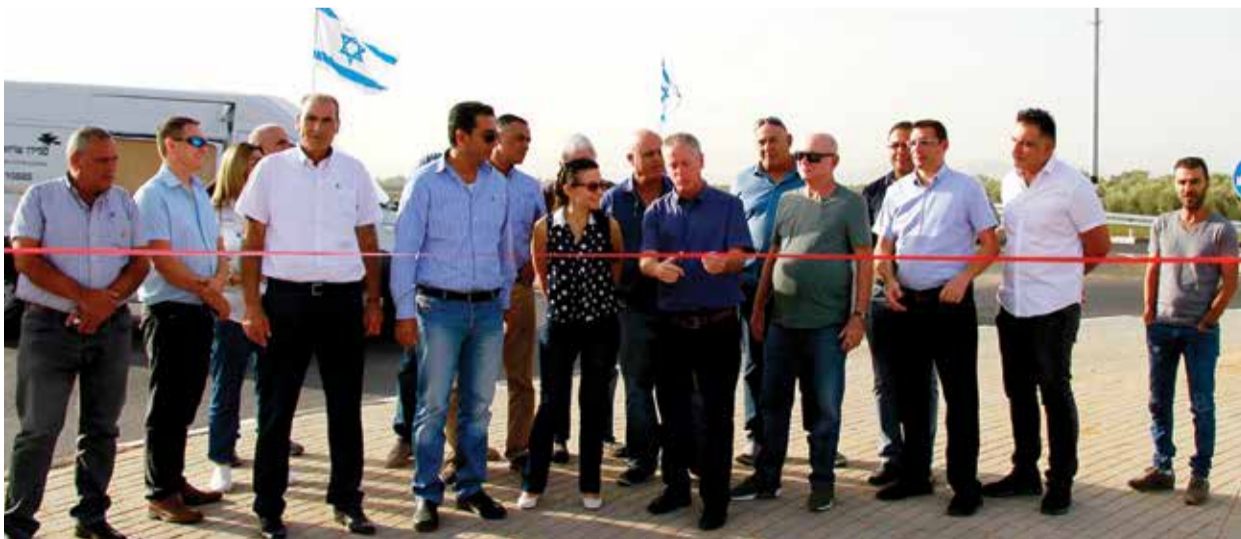
חנוכת הכיכר החדש בגלבוץ

בלוני תבערה אותרו באזור מושב תרומ , צפונית לבית שמש. אזרח שאיתר את הבלונים בסמוך למושב, אסף את הבלונים הגיע לביתו ושם מסר אותם לשוטרי מג"ב. חבלני המשטרה אספו את הפריטים. במשטרה שבים ומדגישים בפני הציבור כי יש לנקוט במשנה זהירות בכל הקשור לחפצים חשודים מעין אלו - אין לגעת או להתקרב לעפיפונים ובלונים, העלולים להכיל בקרבם חומר נפץ ו/או חומרי בערה העלולים לסכן את שלום ובטחון הציבור. בכל איתור של חפץ חשוד יש לדווח למוקד 100 של משטרת ישראל ולהותיר את הטיפול בחפץ החשוד לשוטרי וחבלני משטרת ישראל.