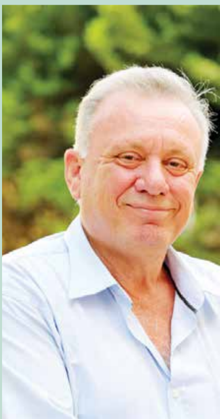
ח"כ איתן ברושי

עלתה ביום שני השבוע, להצבעה בקריאה ראשונה במליאת הכנסת