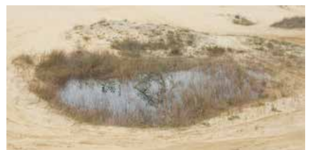
אחד השקעים שנתגלו ליד יבנה