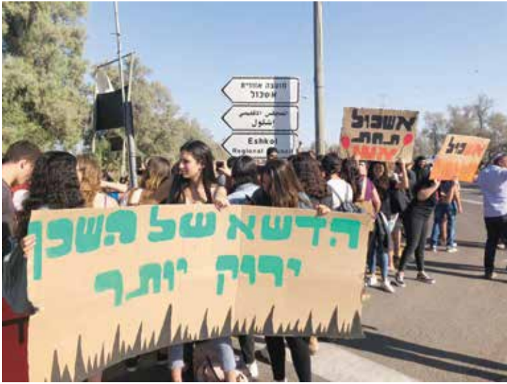
תושבי אשכול חוסמים את כביש 232 השבוע