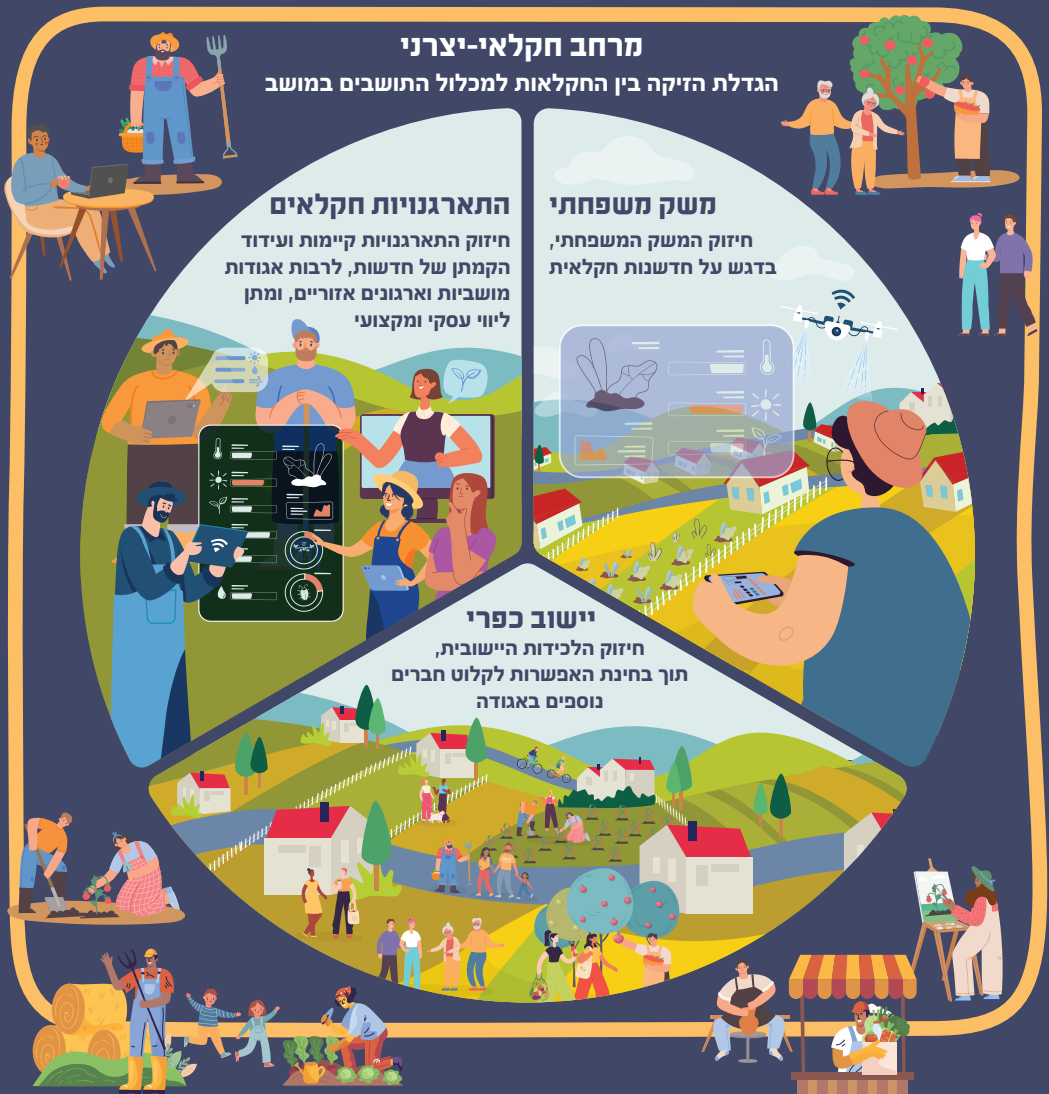
איור 5: המדיניות המומלצת לקידום המושב

המדיניות המומלצת מורכבת משילוב בין החלופות המומלצות בנוגע לכל אחד מרכיבי המושב, כמודגם באיור 5.